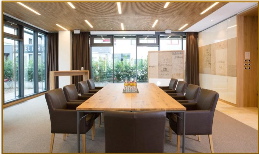
| GEDANKENWERKSTATT |