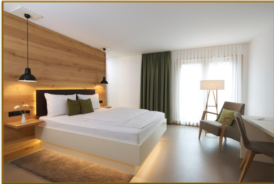
| HOTELZIMMER |