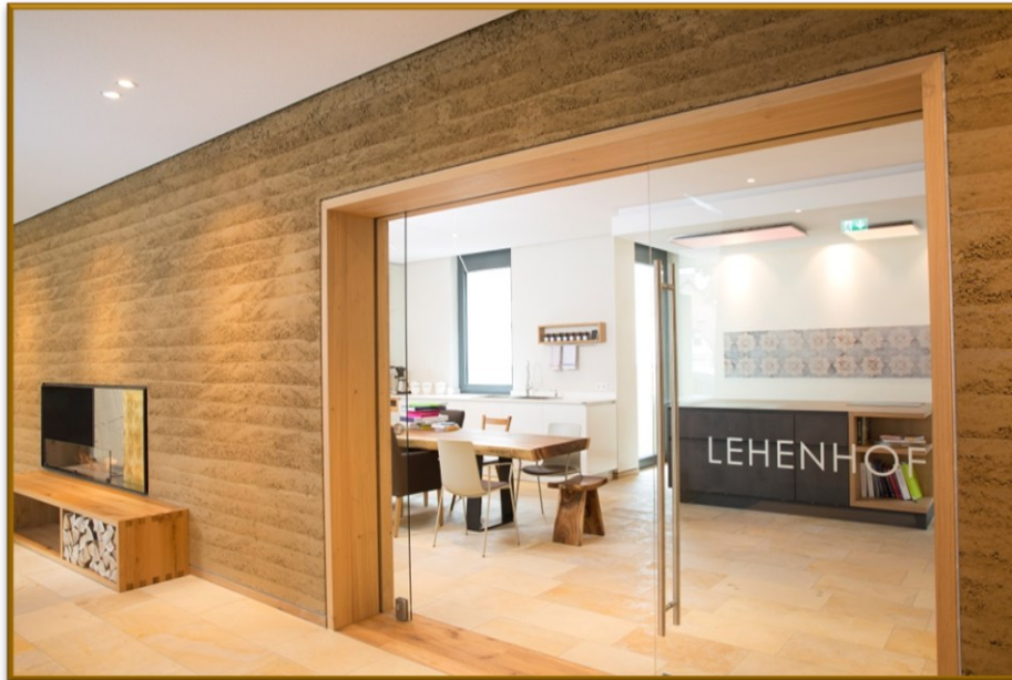
| KREATIVKÜCHE |